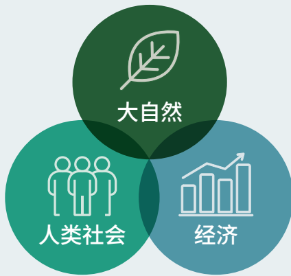
當前的可持續發展模式 4